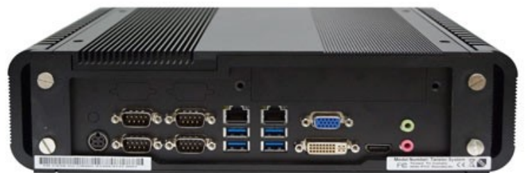
Abb: Rückseite mit Anschlussübersicht

Speicher, den 2 LAN Schnittstellen, bis zu 6 COM Schnittstellen sowie 4 USB Schnittstellen, für ein leistungsfähiges System. Der PC ist komplett