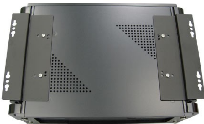
Abb: Befestigung mittels Montageschienen